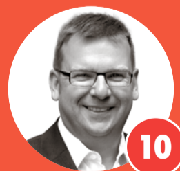
10 LUTZ JACOB